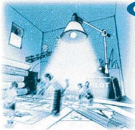
■エントランスB「ピクリ・デスク・ホール」