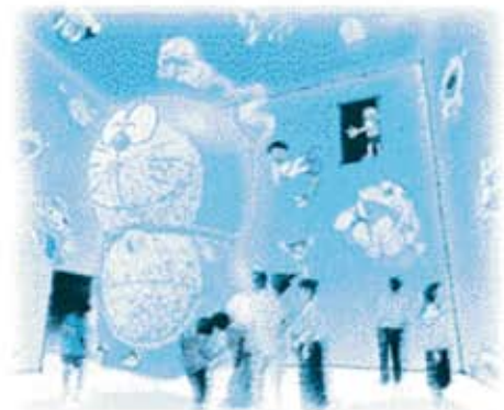
■エントランスA「パノラマボックス」